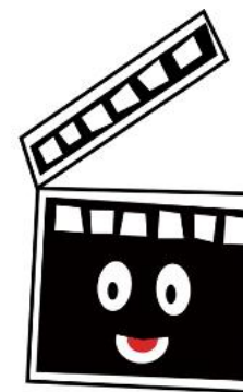
FILM & FOTO